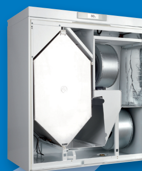
Vallox KWL 080 SC Vallox KWL 090 SC

Enthalpiewärmetauscher für KWL 080, 090 und ValloPlus 500 ab Herbst 2010 erhältlich – optional wählbar, einfach nachrüstbar, absolut hygienisch!