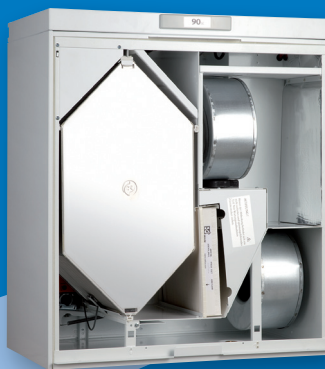
Vallox KWL 080 SE Vallox KWL 090 SE