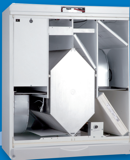
Vallox ValloPlus 500 SC Vallox ValloPlus 500 SE (Passivhaus zertifiziert)